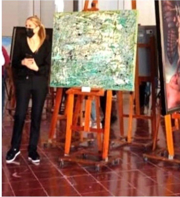
Obra: "Ocaso" de C.Castellot, en la Expo-Colectiva con motivo del Dia Mundial del Arte. Ex-Templo de San José.